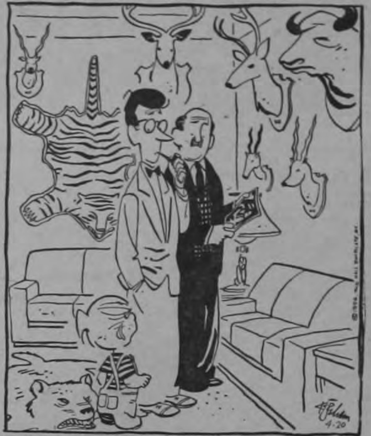
—¡Al perro mío sí que no lo traigo yo a esta casa!