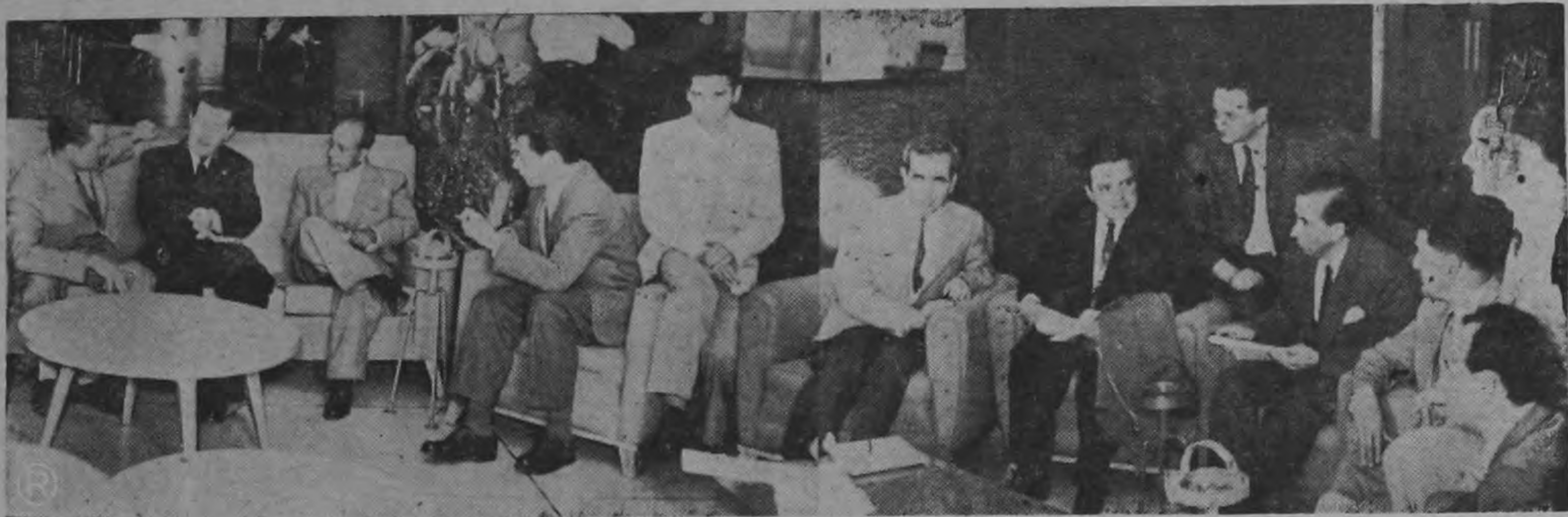
Desde las cinco de la tarde se reunieron los periodistas con los integrantes de la misión que inició en Costa Rica la Jornada por la Libertad de los Pueblos Oprimidos. En la foto un aspecto de la rueda de prensa en el Hotel Europa.

Como lo hemos venido anunciando ayer, en horas del medio día, arribaron al Aeropuerto Internacional de El Coco, los miembros de la Misión pro-Jornada por la Libertad de los Pueblos Oprimidos integrada por seis húngaros que combatieron en Budapest contra los rusos, dos dirigentes sindicales venezolanos, combatientes exilados contra el dictador Pérez Jiménez y dirigente estudiantil dominicano y que lucha contra la satrapía de Trujillo.